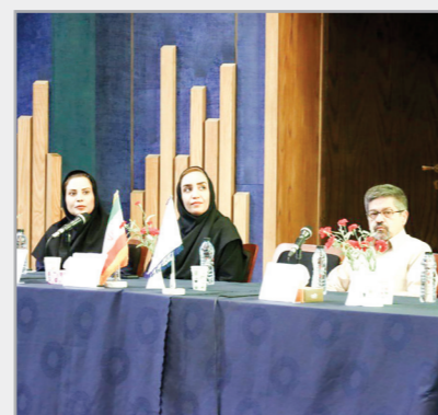
همایش بزرگ سالانه پزشکان عمومی شرق و شمال شرق کشور