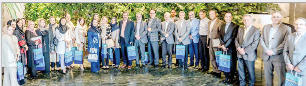
آیین تجلیل و تقدیر از اساتید دبیر علمی در برنامه‌های آموزشی سازمان نظام پزشکی مشهد