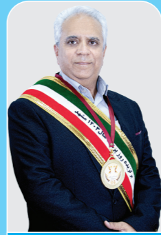
دکتر یوسف شبستری