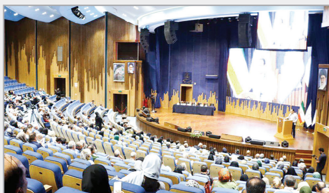
همایش بزرگ سالانه پزشکان عمومی شرق و شمال شرق کشور