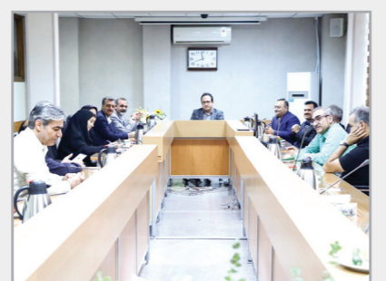
حضور هیأت مدیره کانون وکلای دادگستری به مناسبت روز پزشک