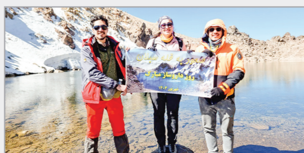
صعود دانشجویان دانشکده داروسازی دانشگاه علوم پزشکی مشهد به قله سبلان به مناسبت روز داروساز