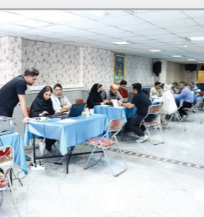
ارائه خدمات اظهار نامه مالیاتی برای اعضا در سازمان