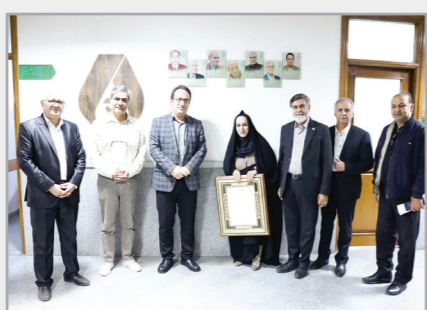
حضور هیأت مدیره سازمان نظام پزشکی مشهد به مناسبت روز پزشک