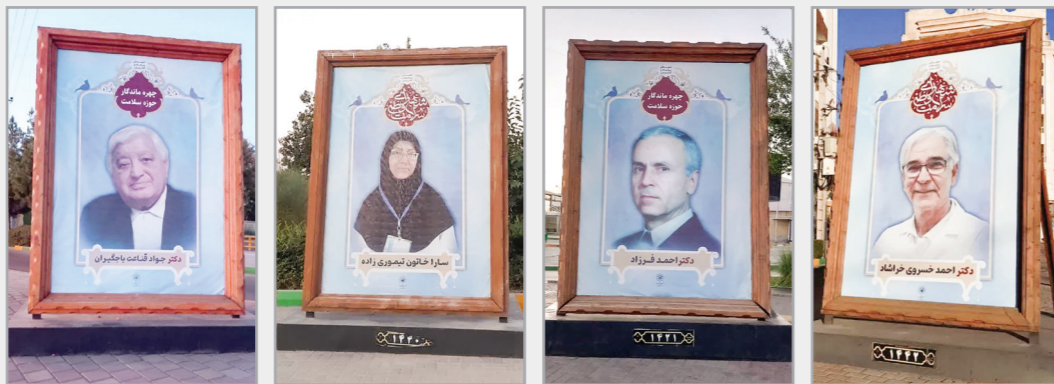
اکران تصاویر تعدادی از مشاهیر پزشکی و شهدای سلامت در سطح شهر با ابتکار روابط عمومی سازمان نظام پزشکی مشهد و شهرداری مشهد به مناسبت روز پزشک و داروساز

برخی از برنامه‌های سازمان نظام پزشکی مشهد به روایت تصویر