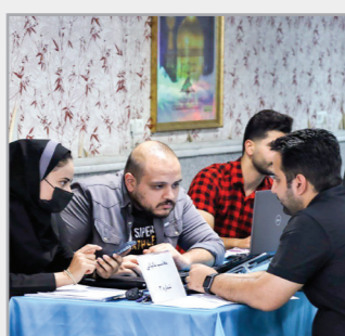
ارائه خدمات اظهار نامه مالیاتی برای اعضا در سازمان